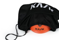
UAC00002 SACCA PORTACASCO