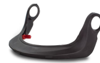
WAC00010 SUPPORTO VISIERA A RETE