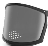
WV100008 VISIERA FULL FACE