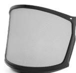
WV100009/10 VISIERA A RETE ZEN